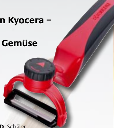
CP-20-RD Schäler drehbar in 5 Positionen