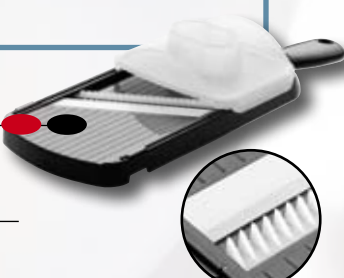
CSN-182-S Julienne-Hobel (inkl. Resthalter) Klinge 8,0 cm